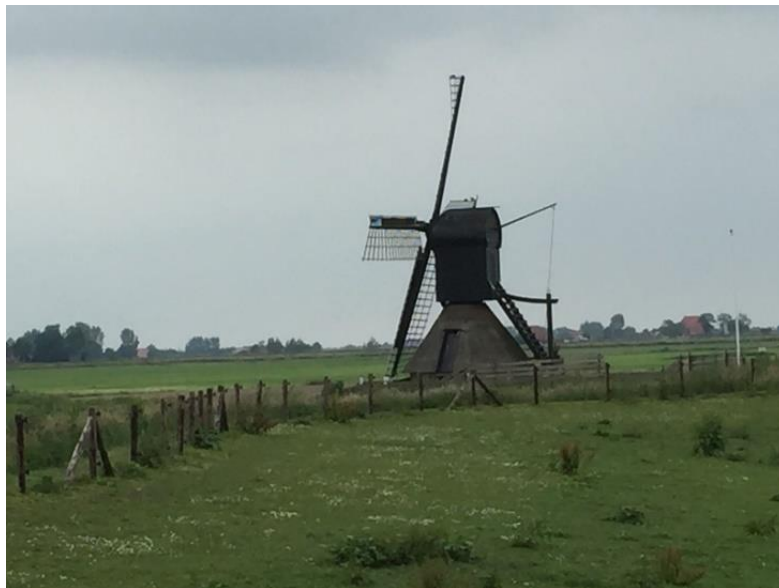
Zo kan molen De Kaap eruit gezien hebben (foto spinnenkopmolen Nijhuizum)

Alle Jans Bokma heeft in Friesland enige bekendheid, omdat hij op de nijverheidstentoonstelling van 1844 te Leeuwarden een bronzen medaille gewonnen heeft met de inzending van een tellurium, een apparaat dat de bewegingen van de aarde en de maan om de zon zichtbaar maakt. Dit tellurium staat nog altijd tentoongesteld in het Planetarium te Franeker.