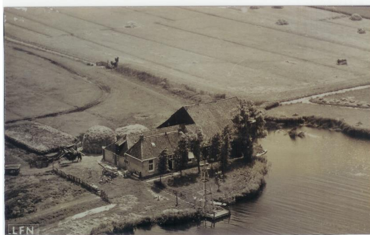
De boerderij van de Renema's aan de Grons