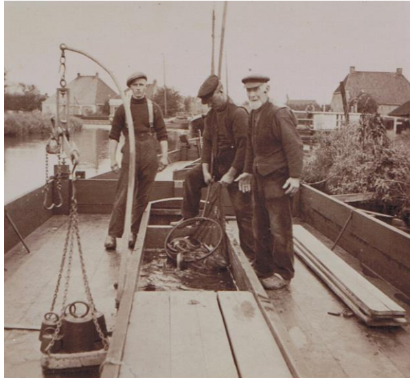
Bemanning op het voordek van een palingaak

ontwerp en het bestek bewaard gebleven en hieruit blijkt o.a., dat de aken uit Workum en Heeg een lengte hebben van 68 voet (een voet is ca. 30 cm) en die uit Gaastmeer 64 voet. De prijs van een romp komt ongeveer op f 8.000. Tel je hier de rondhouten, zwaarden, roer, tuigen, ankelspril en ankers en alle overige inventaris bij op, dan zal een complete palingaak rond 1850 ruw geschat op f 12.000 komen. Palingaken gaan heel lang mee, 40 of 50 jaar is geen uitzondering, maar elk jaar wordt er ook een groot bedrag besteed aan onderhoud en reparaties. Uit de boekhouding van Heeg blijkt, dat dit alleen al bij de werf tussen 500 en 800 gulden per jaar kan bedragen, waar je de vernieuwing van het touwwerk en de zeilen nog moet bijtellen. Naar schatting zijn de jaarlijkse kosten aan afschrijving en onderhoud van een palingaak tussen de f 1.500 en f 2.000.