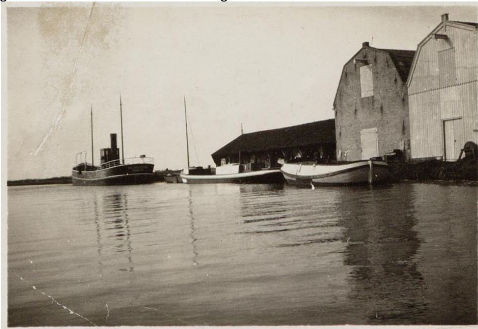
Palinghandel Lankhorst aan de Liuwedaem met ijshok en schuur

In 1782 wordt in de Leeuwarder Courant een verkoping aangekondigd van palingaken, karen en leggers uit Workum, waarbij vermeld wordt, dat hiermee bijna 50 jaar de handel op Londen bedreven is. Dit betekent dus, dat een paar jaar na de tijd dat er vanuit Gaastmeer een palinghandel op Londen ontstaat, er ook zo'n handel in Workum wordt opgericht. En in 1806 kopen de palinghandelaren uit Gaastmeer de laatste palingaken uit Workum. Deze stad heeft tot die tijd dus een niet onbelangrijke rol gespeeld in de palinghandel, die in 1844 weer nieuwe leven ingeblazen zal worden. Zo zijn er in Friesland drie plaatsen met een palinghandel op Londen: Gaastmeer, Workum en Heeg. Maar we gaan ervan uit, dat de oorsprong van deze handel in Gaastmeer ligt.