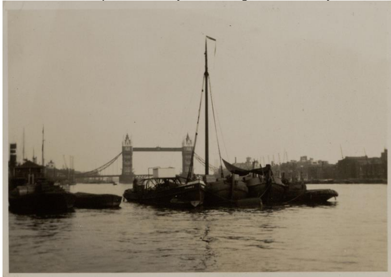
Friese palingaken op de ankerplaats in de Theems te Londen, 1932

Voor Friesland was Londen en omgeving vroeger het belangrijkste exportgebied voor de producten van landbouw en veeteelt, dat is algemeen bekend. Maar ook paling was een belangrijk exportprodukt naar Londen, levende paling. Van 1731 tot de Tweede Wereldoorlog speelde Gaastmeer bij deze handel een belangrijke rol, waarvan op verschillende plekken in het dorp de overblijfselen nog zichtbaar zijn.